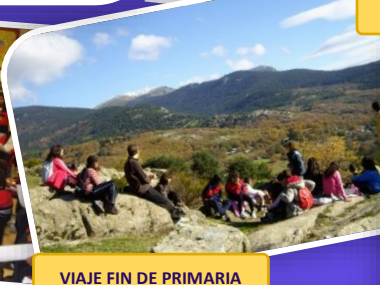
VIAJE FIN DE PRIMARIA