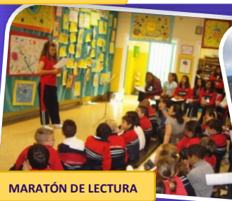
MARATÓN DE LECTURA