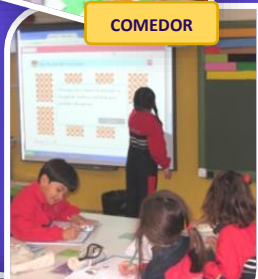
AULAS CON PIZARRA DIGITAL