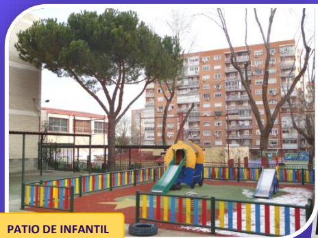
PATIO DE INFANTIL