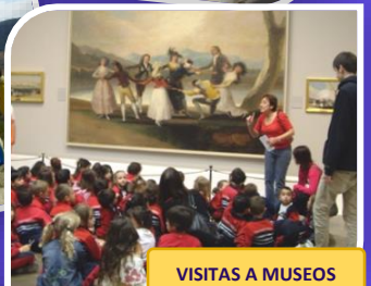
VISITAS A MUSEOS