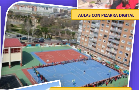
FIESTAS EN EL PATIO DE PRIMARIA